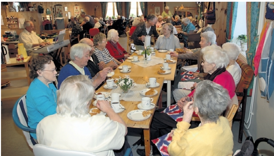
VAFFELTREFF: Besøktjenestens Vaffeltreff har i mange år vært holdt på Hyggestua.

Oppmøte på helsestasjonen. Sanitetsdamer passer barna inne på helsestasjonen mens mor trimmer (ligger barnet i vogn ute blir det på eget ansvar). Kaffespleis: kr 10,- Velkommen!