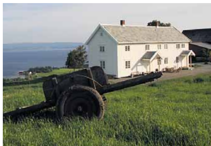
UTSIKT: Besøkende ved Husfrua blir begeistret over den fine utsikten.

Søndag 15. august F: DUGURD- MED MAT FRA VINJES TID