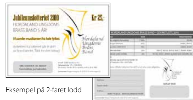
Eksempel på 2-farget lodd

Skrapfeltet ligger fast, ellers kan loddet utformes etter eget ønske med logo, navn og design.