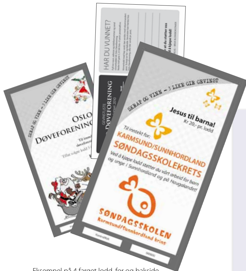
Eksempel på 4 farget lodd, for og bakside