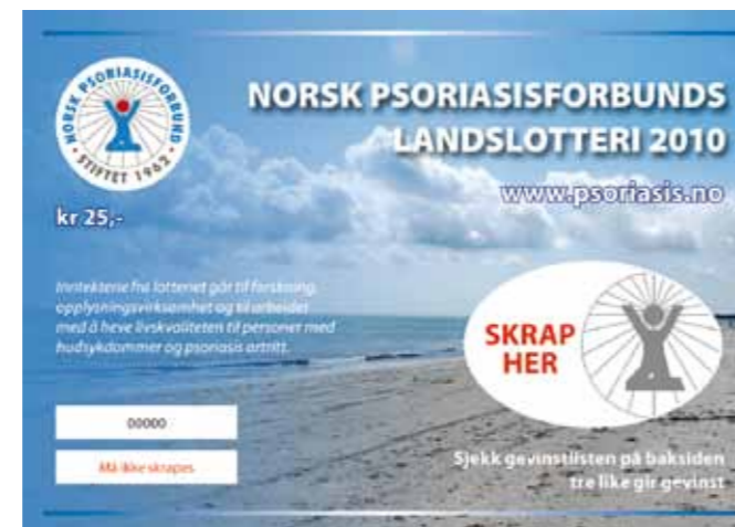
Eksempel på 4 farget spesialdesignede lodd