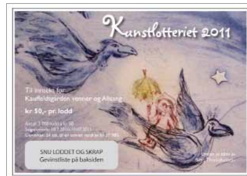
Eksempel på 4 farget lodd, for og bakside