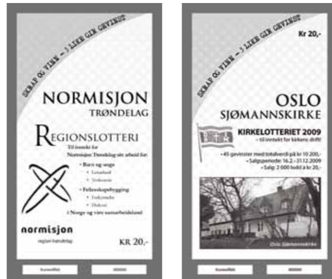
Eksempel på sort hvitt lodd

Loddkjøperen skraper frem tre like symboler og kan med en gang sjekke om man har vunnet. Loddet har fast gevinstutgang – det betyr at antall gevinster er gitt på forhånd. Gevinster kjøpes hos oss – eller du kan ha egne gevinster, gitt at antallet stemmer. Se tabell nedenfor.