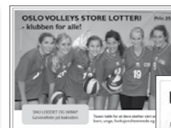
Eksempel på sort/hvitt lodd