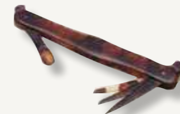
Sett med tre neglerensere og en øreskje i skilpaddeholder. Fra siste del av 1800-tallet.

Og med et lite google-søk finner vi det også i samlingen på Maihaugen. Den brukes visstnok også i mange asiatiske land.