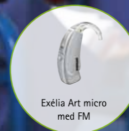
Exélia Art micro med FM

For bedre taleforståelse i de viktige læreårene