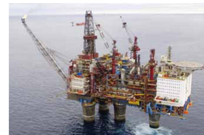
Gullfaks A plattformen, foto: Øyvind Hagen/Statoil

Seminaret ”Støy – vender vi det døve øret til?” ble overført direkte på Ptils nettsted, og er i etterkant tilgjengelig som opptak.