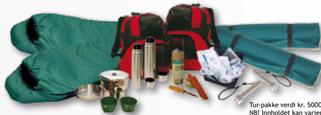
Tur-pakke verdi kr. 5000,- NB! Innholdet kan variere.

Enkelt og lett vint. Bestill julekalender og gevinster samtidig. Gevinstpakkene er tilpasset krav til gevinstverdi (minimum 25% av lotteriets omsetning). Velg antall julekalendere dere ønsker å bestille, og få gevinstene levert samtidig med julekalenderene.