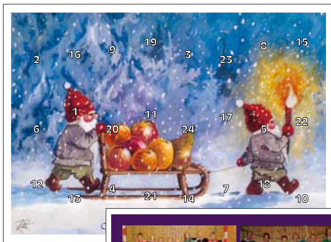
Forside motiv Kjelken nr. 22