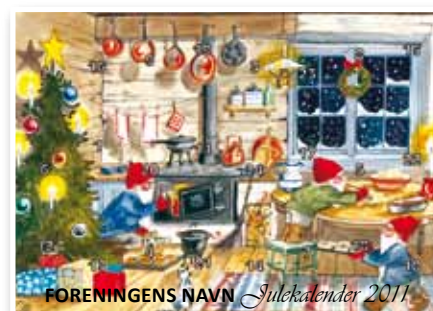
Motiv, Julebaksten nr. 21