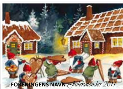
Motiv, Julebaksten nr. 20