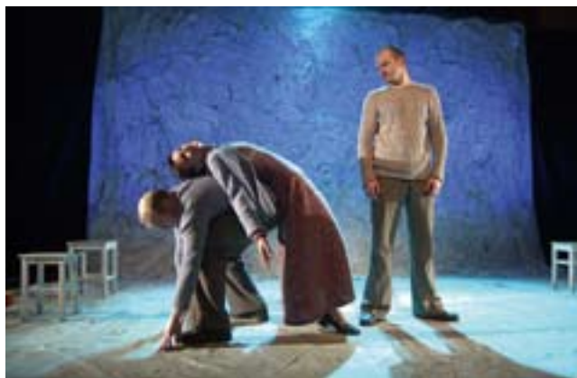
Fra oppsetningen Historier fra en glemt koloni .

– Alt gikk tapt, absolutt alt. Scenografi, kostymer, lyd -