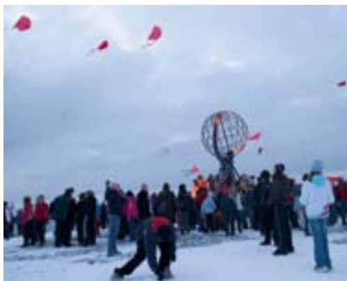
Drager over Nordkapp under kulturskolefestivalen.

Som en av tre hovedarrangører (sammen med Nordkapp Kulturskole og Norsk kulturskoleråd avd. Finnmark) var dette arrangementet viktig for Finnmark revy – og teaterverksted. Vi fikk endelig anledning til å gjøre konkret nytte for oss og vise at denne institusjonen kan gjøre en jobb for kulturlivet i Finnmark. Kulturskolefestivalen ga oss kanskje sjansen til å vise selve essensen av hva FRTV er ment å skulle gjøre, nemlig å samle folk og skape arenaer for positive kulturelle møter. Vi satt igjen med en følelse av at det var vellykket denne