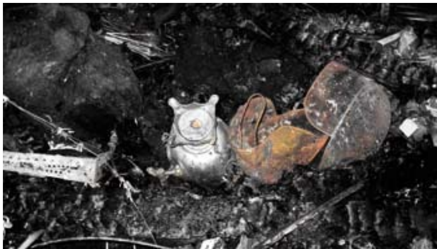
Rå ruin, en samovar og to fektmasker alene igjen etter brannen.

Samovar (Russisk tekoker) betyr sjølkoker. Den er varm, vakker å se på, noe man kan fylle opp i og tappe ut av. Og så småputrer den hele tiden. Slik mener vi at et teater også bør fungere, derfor Samovarteateret.