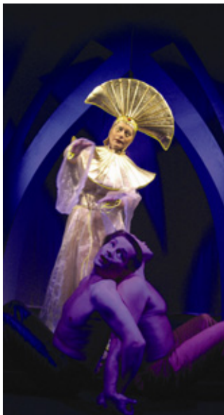
Fra forestillingen "FAUST"