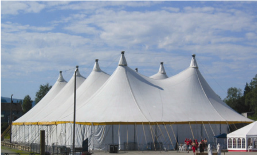
Hoved-arenaen under revyfestivalen