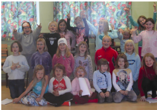
Glade unger i Ismyggtroppen!