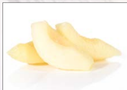
Pære i båter Norsk Polar 4 x 2,5 kg EPD: 3105210