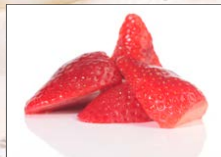
Jordbær i biter Norsk Polar 4 x 2,5 kg EPD: 3097003