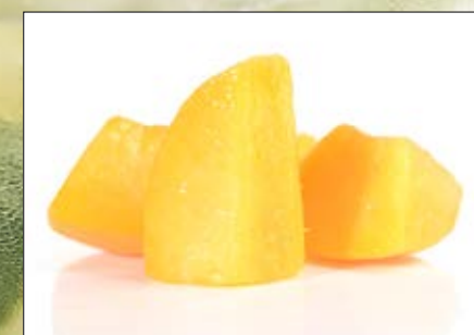
Fersken i biter Norsk Polar 4 x 2,5 kg EPD: 3104726