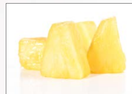
Ananas i biter Norsk Polar 4 x 2,5 pose EPD: 3097797

*Organoleptiske egenskaper = smak, utseende, konsistens og duft