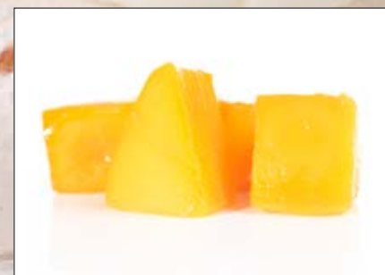
Mango i biter Norsk Polar Vekt EPD: 3096864