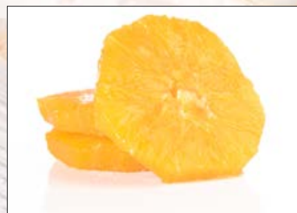
Appelsin i skiver Norsk Polar 4 x 2,5 kg EPD: 3098050