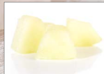
Melon i biter Norsk Polar 4 x 2,5 kg EPD: 3099793