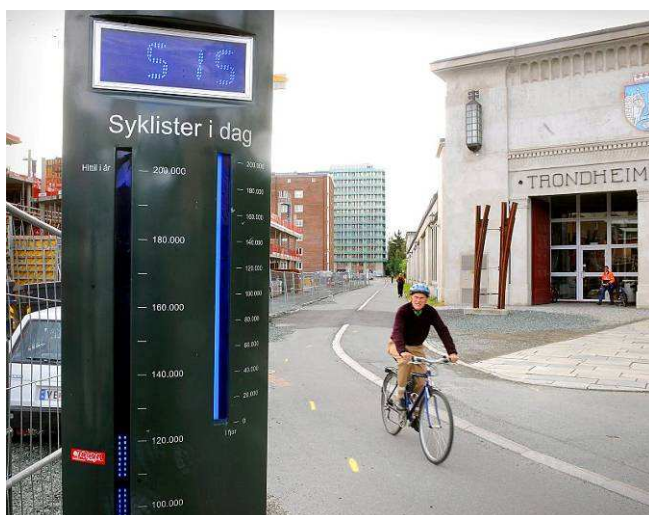
Sykkelbarometer i Trondheim

Barometerne vil også plasseres på andre steder enn dagens telleboks, slik at man får en større bredde i tellingene i hele Alta. Tellingene er det eneste faktagrunnlaget som er angitt som målbart resultat for sykkelbyen. Viktigheten av en større bredde enn årlige tellinger i ei uke bør derfor vurderes svært nøye. Denne typen telleverk koster mellom 150 000 - 200 000 kr.