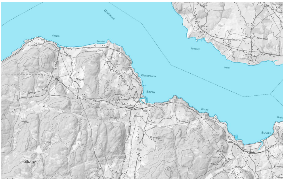
Figur 3: Kartet viser havnivået i 2090 ved 200-års stormflo [8].

Stormflo forårsakes av sterk pålandsvind, høyvann og lavtrykk. Høyere havnivå kan i framtiden gi noe sterkere stormflo. Prognoser om framtidens klima sier at det vil bli mer ekstremvær.