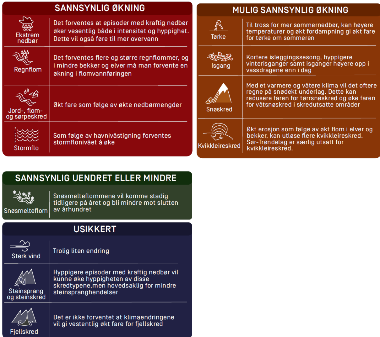
Figur 4: Figurene viser Sør-Trøndelags klimaprofil fra 2021 [7].

Skaun kommune har store skogområder som medfører en viss økning av sannsynligheten for skogbrann lokalt. Avgrensing mellom ny bebyggelse og skogsmark er enkelt grep som kan gjøres gjennom reguleringsplan.