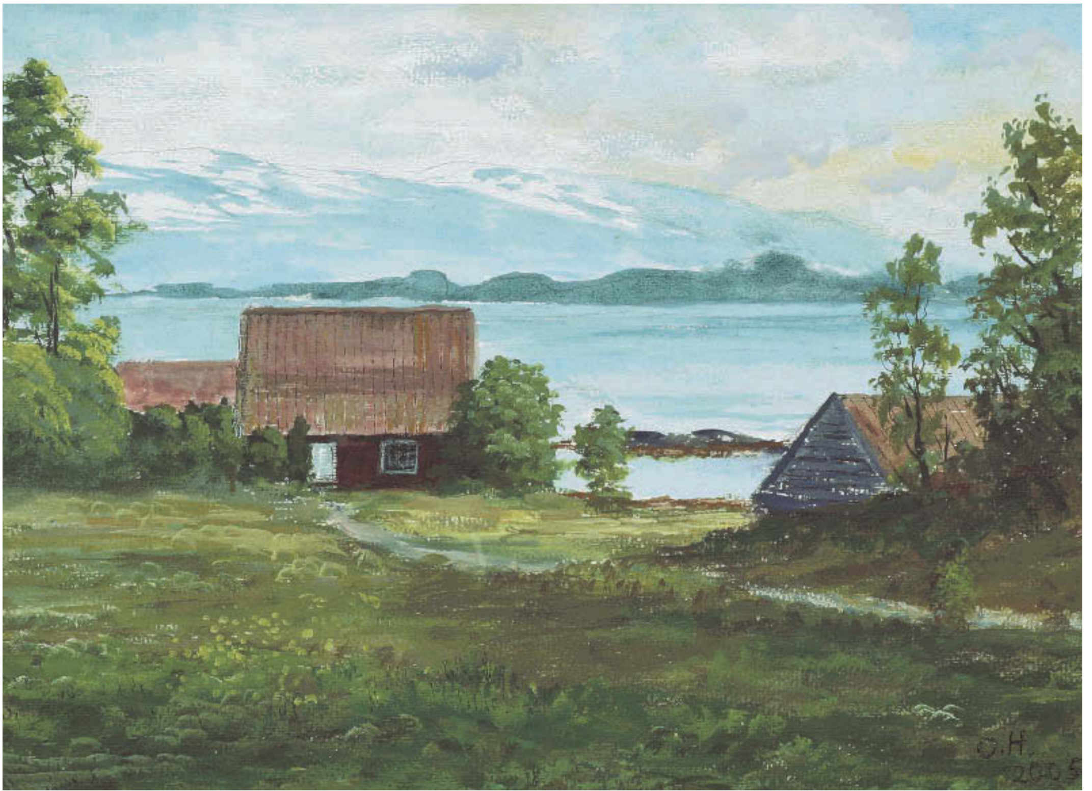
Olav Høgestøl – "Idyll ved Onarheimsfjorden"