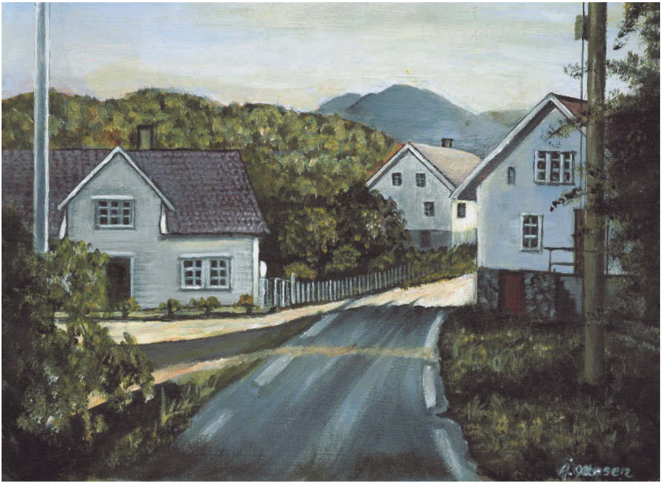
Åse Ottesen – "Flåtahjørna"