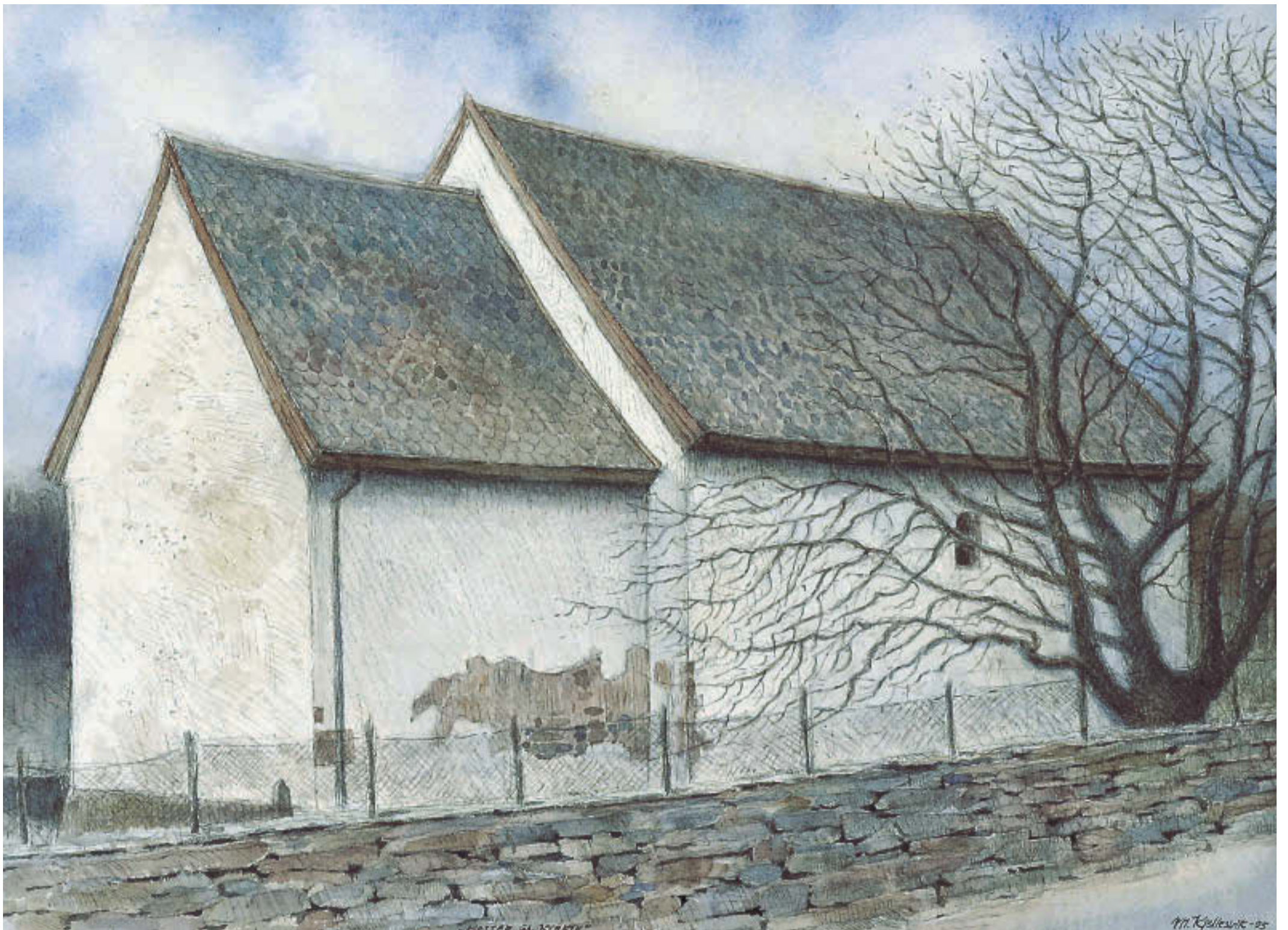
Magne Kjellesvik – "Moster gamle kyrkje"