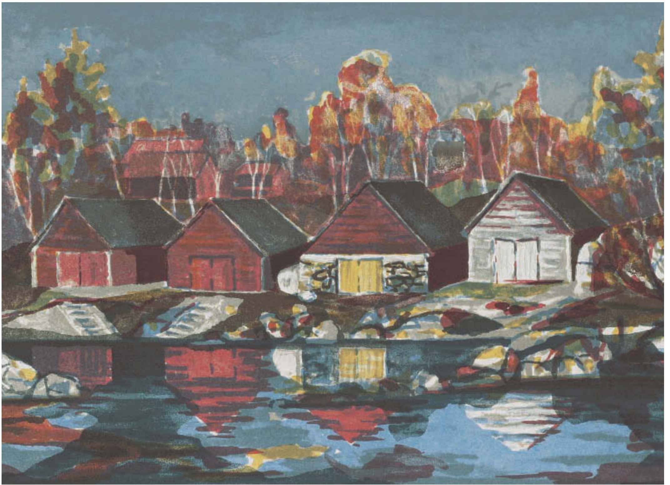
Sigurd Søreide – "Naust"