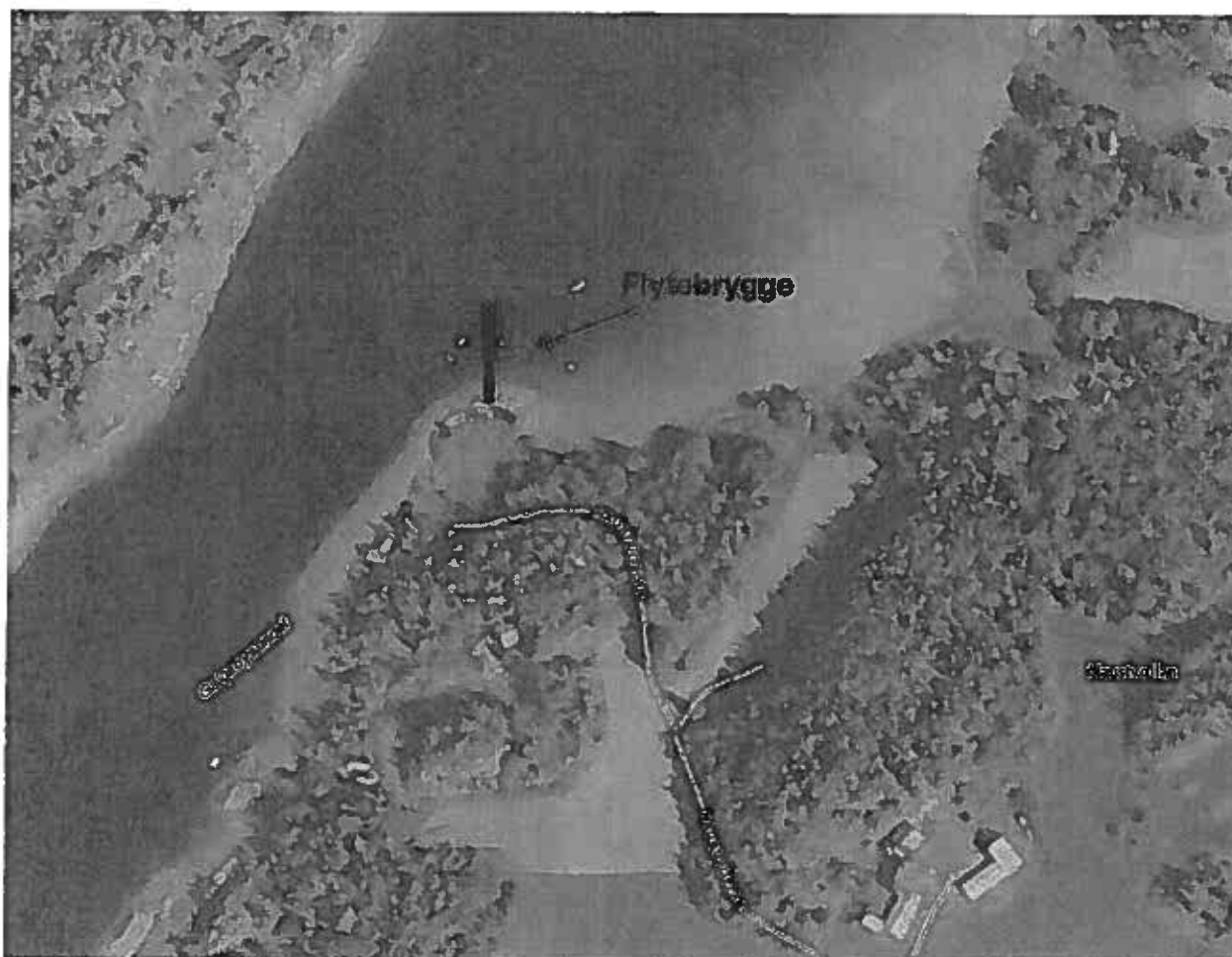
Flyfoto, med flytebrygge vist i målestokk (lengde 41 m fra forankring i berget).