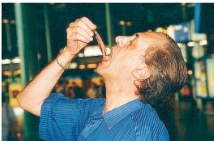
RÅSLAFSING. I Nederland skal lettgjæret sild slukes i noen få biter. Men det er hemmelig at den er norsk.

En heldig misforståelse. Stoccafisso ble en enorm suksess i Badalucco og etterhvert i andre innlandsbyer. Den katolske kirken velsig-