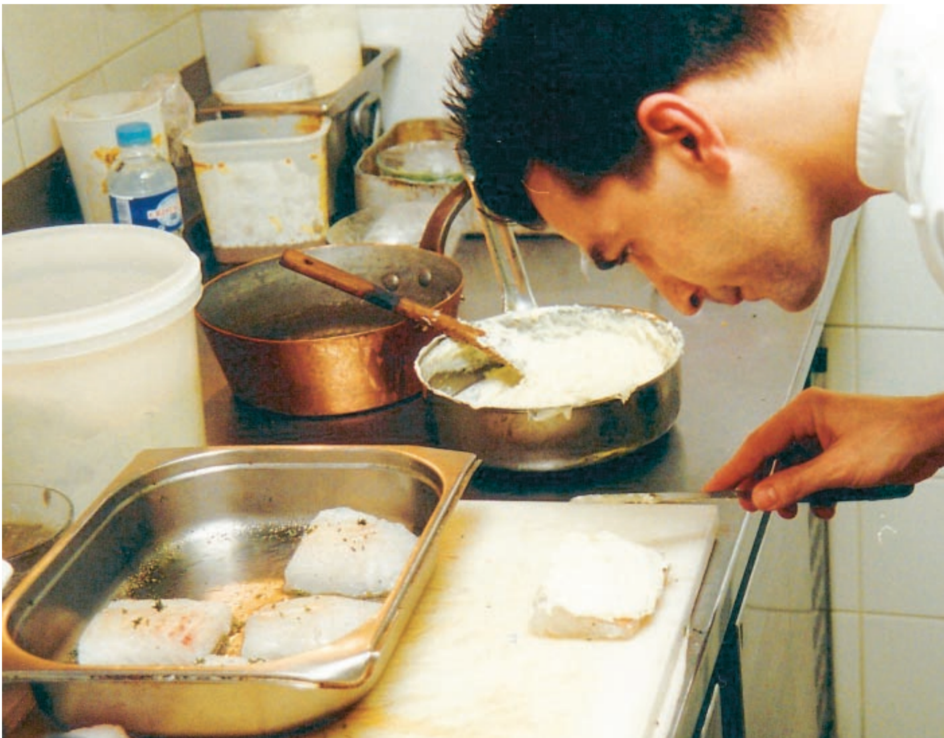
SKREIDE LA NORVÈGE. Stjernekokken Yannick Alleno elsker fersk skrei fra Lofoten. Tidligere har mangelen på fersk fisk i Paris ført til både kongelige dusører og selvmord.

I DEN NORDITALIENSKE byen Badalucco er den norske tørrfiskens legendarisk. Ifølge legenden ble byen beleiret av nordafrikanske angripere på slutten av 1500-tallet. Det fantes nesten ikke mat i byen, men innbyggerne holdt stand. De hadde et stort lager av tørrfisk – fra Norge.