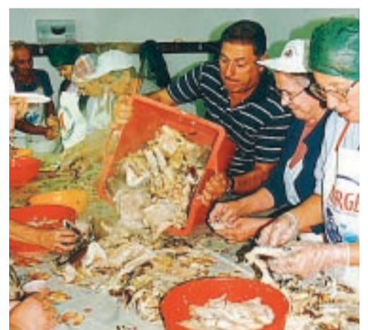
VIVA TØRRFISK! Italienerne spiser et halvt tonn tørrfisk på en dag under den årlige festivalen.

Tørrfiskens som blir tørket på stokker, er svært populær i Italia. Men den fisken som