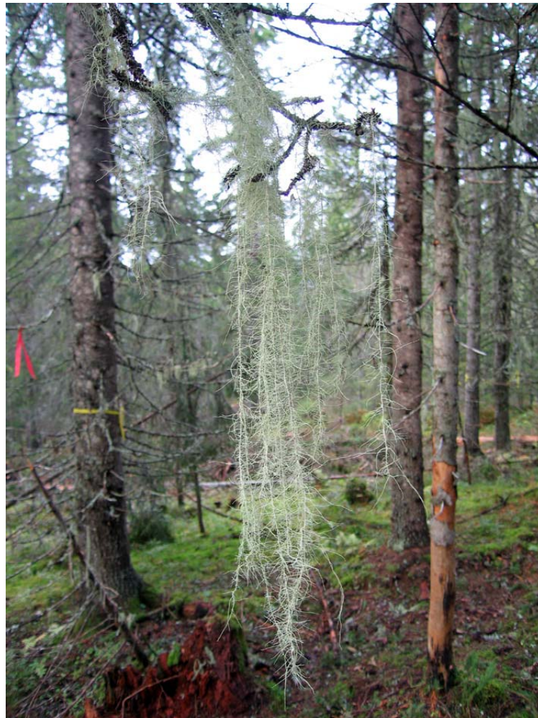
Huldrestry etter gjennomhogst.

Siden en i Lillehammer og Mjøsen har et spesielt ansvar for huldrestry, vil det bli gjennomført et forskningsprosjekt sammen med Skogforsk på forvaltning av huldrestry.