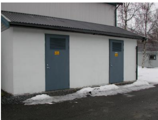
Topp moderne nettstasjoner