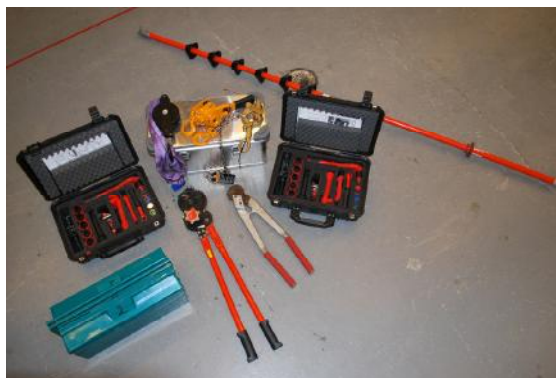
Det meste av utstyr og verktøy som kreves har vi til utlån for våre kurs—og fagprøvekandidater.