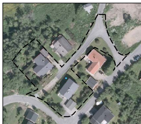
Ny planavgrænsning som stiplet svart linje