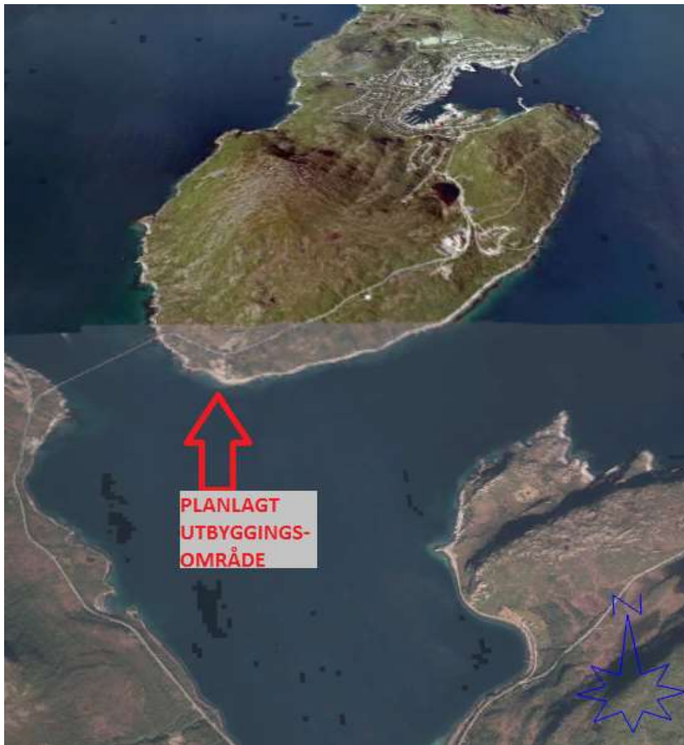
Figur 2. Lokalisering av planlagt utbyggingsområde

Reguleringen skal legge til rette for oppføring av et større settefiskanlegg for mer enn fem millioner settefisk på deler av området.