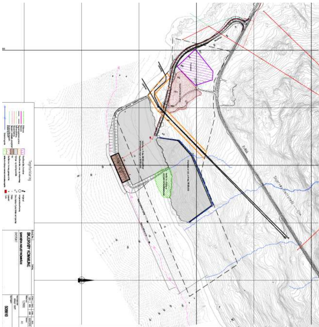
Figur 3. Planområdets utstrekning

Langbakken ventes å være ferdig i løpet av våren 2014, og planområdet for Sandøra industriområde vil da tilpasses dette.