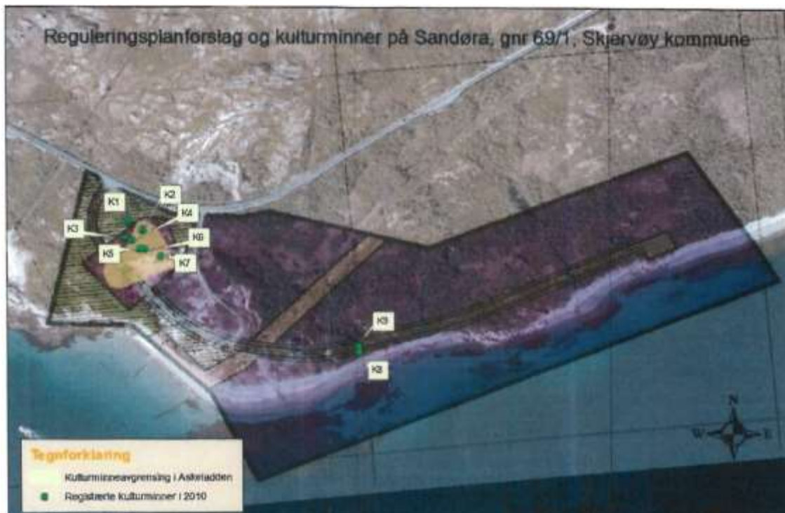
Figur 4. Oversikt over registrerte kulturminner

Adkomstveien inn til planområdet vil legges utenfor hensynssonen til de 7 kulturminnene.