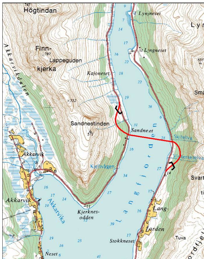
Prinsippskisse for undersjøisk tunnel under Langfjorden

ca 200 mill kr med en usikkerhet i anslaget på +/- 40 %