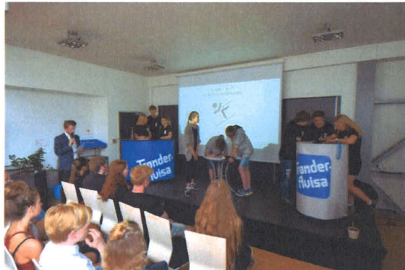
Bilde fra finalen i Fem rette .

Vi er inne i de siste ukene av skoleåret 2015/2016, og ferien er like om hjørnet. Sist uke kunne vi glede oss over 10.klassenes gode innsats i Fem rette . Med 1.- og 3.plass i konkurranse med 500 lag fra vårt distrikt, kan vi være stolte av våre elevers innsats. I tillegg til de som kom på premiepallen, gjorde også lag fra øvrige klasser en flott innsats i konkurransen.