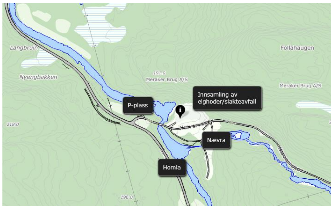
Kart: Innsamling av elghoder og slakteavfall ved steinbrudd, Follahaugen i Mostadmark.

Det legges i år opp til innsamling av slakteavfall i kontainer som blir levert til Norsk Protein. Ressursen blir dermed utnyttet og mindre mat blir tilgjengelig for smårovviltet, som igjen har betydning for bla. rådyr og bestandene av småvilt. Mindre slakteavfall i marka kan også være forebyggende i forhold til smittepresset knyttet til sykdommen CWD, (føre-var-prinsippet). Kontainer blir plassert ved steinbruddet i Follahaugen i Mostadmark (se kart). Innsamlingen finansieres av rettighetshaverne og kommunale viltfondsmidler.