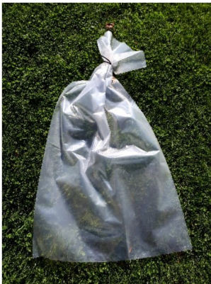
Plastikk sekk for indre organer –stripses og tas med ut av terrenget sammen med skrotten