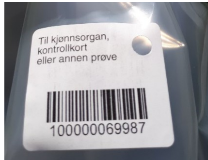
Plastikksekk merkes med egen merkelapp for hvert dyr.