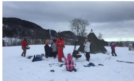
Sameleir med servering av bidos(reinsdyrsuppe)