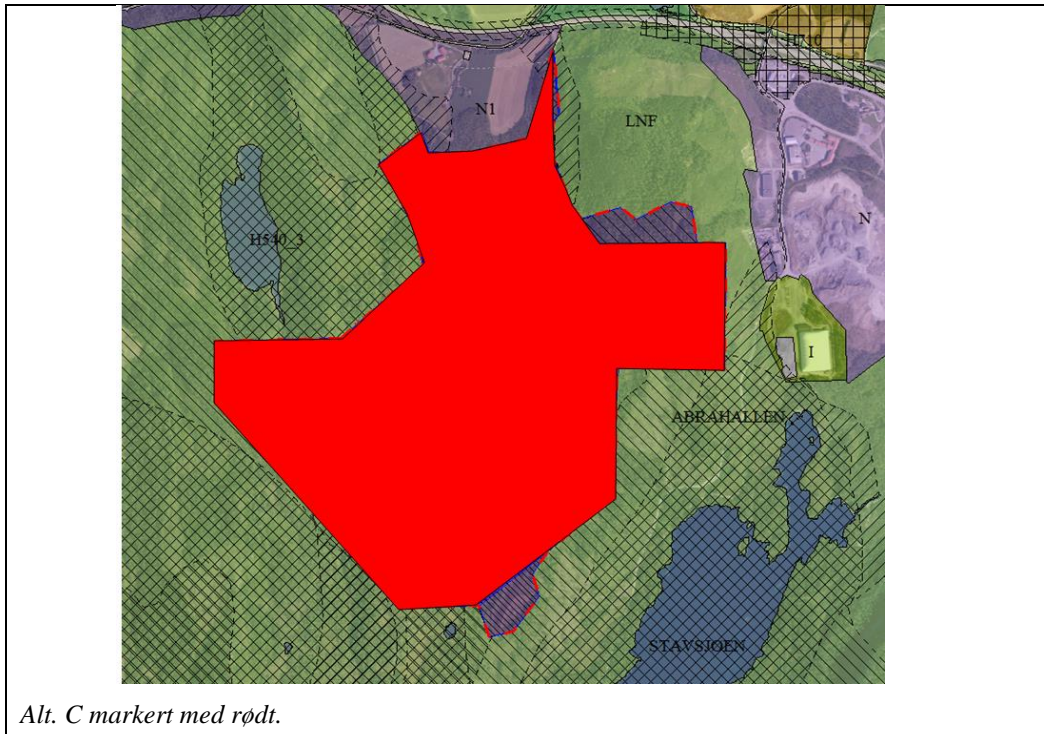
Alt. C markert med rødt.