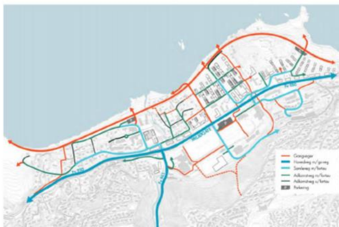
Figur 24: Gatebruksplan med gatehierarki

Av dette tolker vi at kommunen tenker å erverve betydelige arealer av de tilgrensende eiendommene til Kongshaugveien. Av gatebruksplanen som er presentert (s.41 Planbeskrivelsen, fig 24) ser vi at Kongshaugveien er definert som en adkomstveg med fortau.