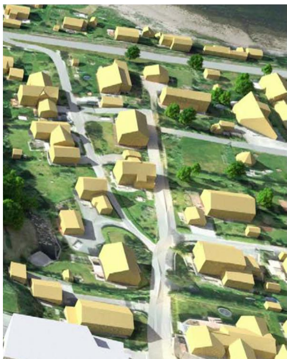
Bilde 2 Illustrasjon fra Asplan Viaks illustrasjonshefte, som viser utvidelse av Kongshaugveien til en adkomstveg med fortau, og med nye gang- og sykkelveger som tar arealer fra våre eiendommer.

For våre eiendommer vil dette medføre betydelige tap av verdifulle arealer som i dag er del av våre hager. I tillegg ser det ut til at det planlegges en gang- og sykkelsti som skal anlegges tvers gjennom hagen til Kongshaugveien 5, og inn på gårdsplassen til Kongshaugveien 1 B. Dette er illustrert i Asplan Viaks illustrasjonshefte som vist under.