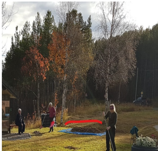
Minnestøttenes ønskede plassering, se rød linje.

Steinene skal plasseres i en halvbue mellom to bjørketrær. Dette vil gi en fin ytre ramme. Det er tenkt å etablere et lite felles blomsterbed foran steinene.