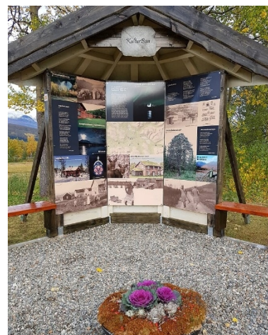
Kulturbua i Øverbygd.

Øverbygd Velforening har opparbeidet et fint parkområde på kommunens areal i Øverbygd sentrum. Velforeningen har et mål om at dette området ikke bare skal være en rasteplass, men også et sted hvor lokale og tilreisende kan få informasjon om, og bli eksponert for, lokal kultur og historie. Det vil også være informasjon om hvor man kan dra for å oppleve mer kultur og historie. De foreslår å flytte tre ulike minnesmerker som representerer ulike milepæler i Øverbygds historie, til denne parken.