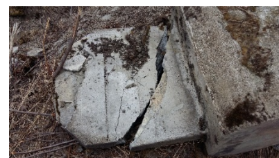
Brukket stein i Solbergkleiva 2017.

Selve steinen er brukket i to etter snøbrøyting vinteren 2016/17. Delen med inskripsjon er ikke berørt. Støtten bestod av et massivt sementfundament, som steinen med inskripsjonene var støpt i. Det synes som en overkommelig oppgave å få steinen i nytt fundament igjen. I dialog har grunneier gitt uttrykk for at en flytting er i orden, forutsatt at minnesteinen er godt synlig og at det lages en infotavle som forteller om bakgrunnen for steinen.