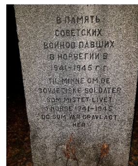
Minnesmerke over sovjetiske krigsfanger som mistet livet.