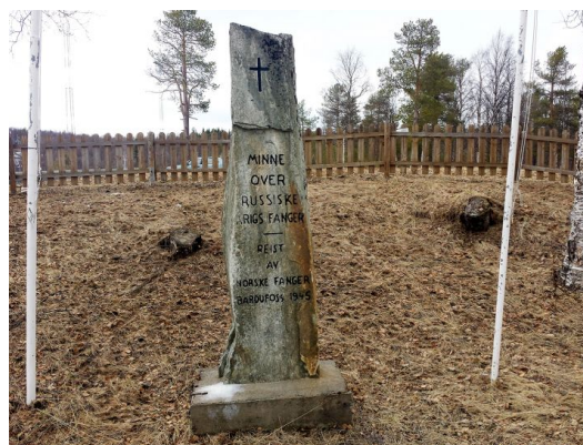
Minnestein over russiske krigsfanger på Bardufoss. Her lokalisert foran Samfunnshuset på Rustahøgda(revet).

I 2015, i forbindelse med bygging av nye Bardufoss videregående skole, ble steinen i flyttet til Midt-Troms museums lokaler i Sundlia. Der er den midlertidig lagret i påvente av ei permanent plassering.