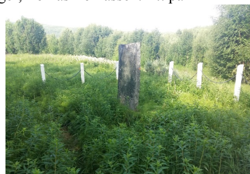
Minnesmerke over Tomas Tomassen