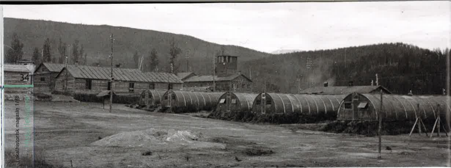
Russefangeleiren på Bjørnåsen. Her var det i hovedsak russiske fanger, og de buede brakkene ble kalt Nissen-brakker. Disse ble levert som ferdig-elementer til å skru sammen. Dette var inne på området til det som i dag er Bardufoss flystasjon.