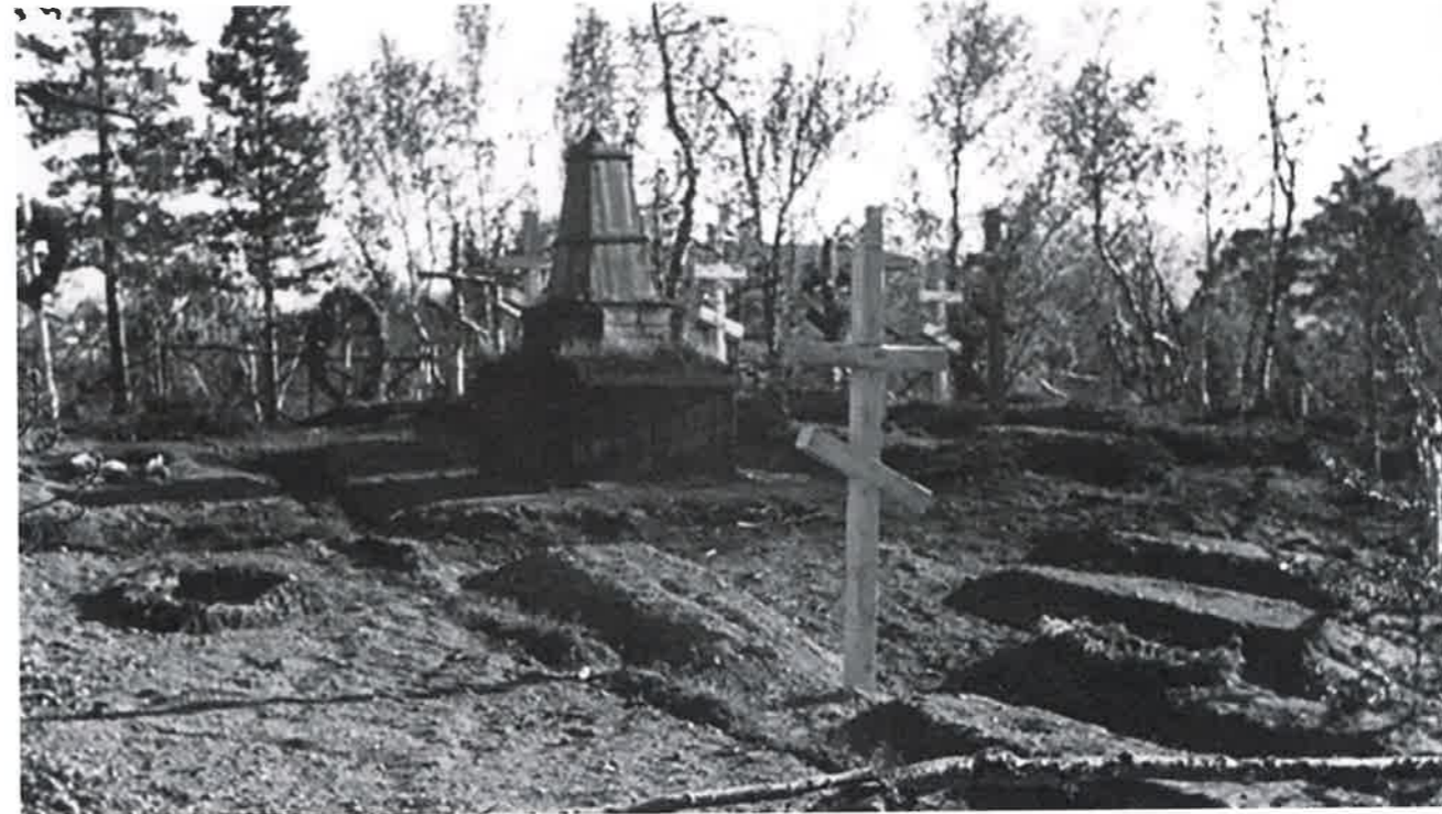
Gravplass for russiske fanger som døde i tysk fangenskap. Dette er Haraldhaugen i Øverbygd. Alle gravene ble fjernet under Operasjon asfalt og i dag er det bare en minnestein igjen der. Alt vi ser på bildet er borte.

delen av vår lokale krigshistorie. Målet er «å bidra til å gi nye generasjoner direkte og bedre kjennskap til norske og utenlandske krigsfanger som var internert i området».