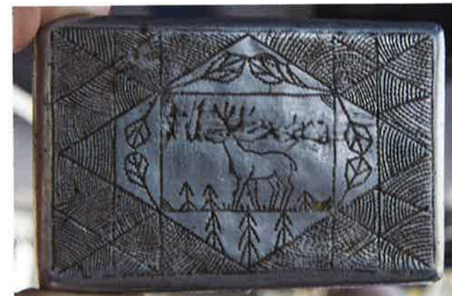
Fangearbeid laget i fangeleir i Målselv. Slike arbeider laget fangene og ga til lokalbefolkninga, enten i bytte for mat eller som takk for mat.

Den norske politiske leiren lå i samme område. Hit kom det fanger fra Grini i 1943. Leiren bestod av fem større brakker, hvorav den femte var for tyskvennlige, russiske fanger. Disse ble behandla bedre enn de ordinære russefangene, og de norske fangene hadde ingen kontakt med dem. Etter frigjøringa ble den norske leiren benytta som landsvikleir til 1948. I forbindelse med tyskernes utbygging av flybasen på Bardufoss, ble det opparbeid ny flystripe (tverrvindstripe) og bygd taxebane (Baggerstrasse). Fangene ble satt til å rydde skog, fjerne røtter