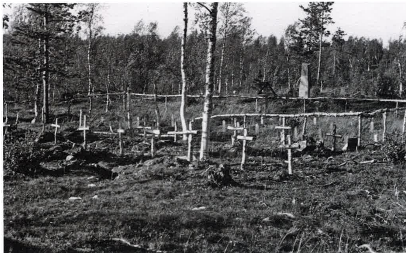
Gravplassen for Russefangene på Rustahøgda fotografert i 1945. Disse gravene ble også gravd opp og flyttet i det som ble kalt Operasjon asfalt. Bakerst til høyre ser vi samme minnestein som nederst på s. 34.

Målselv Historielag vil fortsette arbeidet med å samle historier og bilder som dokumenterer fangenes historie. Vi ønsker å gjøre materialet tilgjengelig på historielagets hjemmeside/egget nettsted slik at alle interesserte kan få tilgang til denne viktige