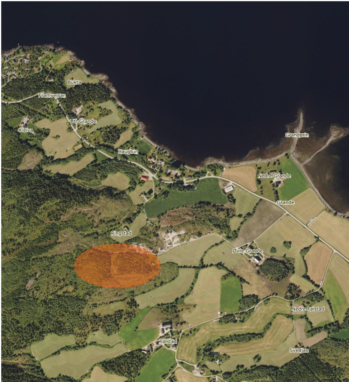
Planområdets beliggenhet vises med oransje markering.