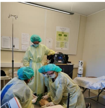
Øving i fyrstehjelp i koronatider

Til no har 147 svart på undervegs-evaluering av beredskapsarbeidet i Seljord