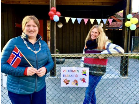
Frå opninga av Heddeli barnehage 23.04.20