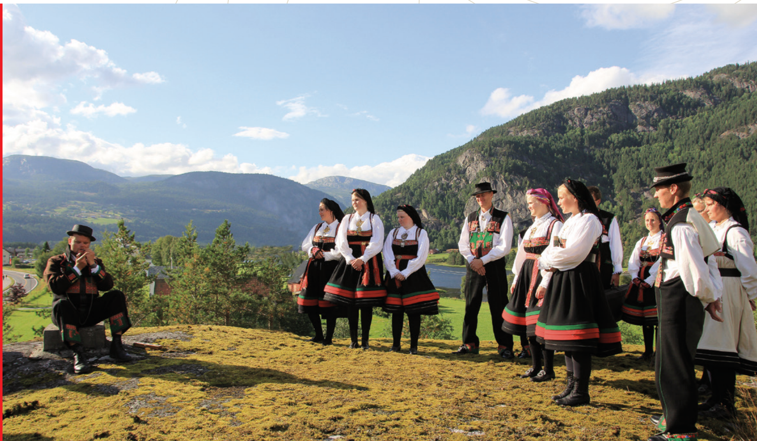
Den gamle danseplassen på Hämåren, Rysstad.