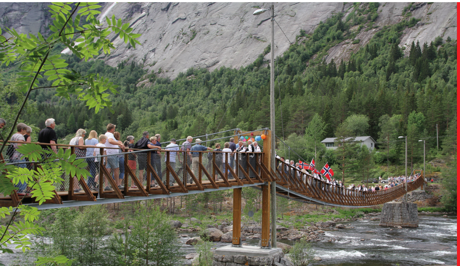
Folkefest i Valle då Prestefossen hengebru var sett i stand og opna att.

Gjere alle turstiane og turløypene mest mogeleg attraktive. Ein bør vurdere kulturminneskilting/-merking på dei turløypene der dette kan vere aktuelt.