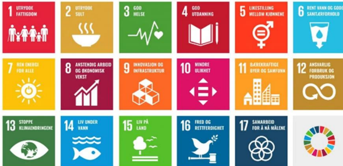
Figur 2: FN sine bærekraftsmål

Alle planar som vert utarbeida nasjonalt, regionalt og lokalt skal seie noko om korleis planen legg opp til å arbeide mot FN sine 17 bærekraftsmål. Berekraftig utvikling vil vere den røde tråden og einaste arbeidsmetode i næringsplanen, handlingsplan og verkemiddelbruk. I arbeidet med næringsplanen skal ein definere nokre satsingsområde som skal ha særleg fokus i vidare arbeid med næringsutvikling i Lærdal.