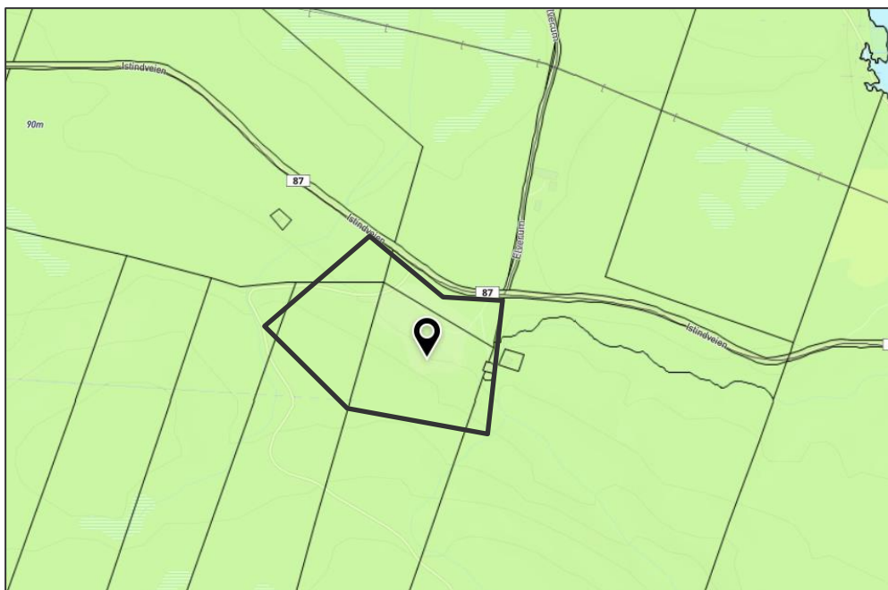
Figur 2: Planstatus. Omtrentlig planområdet er markert med svart strek.

Planområdet ligger langs Istindveien og på vestsiden et stykke unna Kirkeselva og er en del av gnr./bnr. 47/5 og 47/1. Gjeldende plan for området er Plan-ID 5418_2012KPLAN Kommuneplanens arealdel, vedtatt 13.12.2012. I denne planen er aktuelt område avsatt til LNFR.