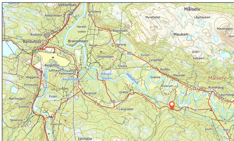
Figur 1 Oversiktskart. Planområdet er vist med rød markør. Kilde: Norgeskart.no Under redegjøres det for planarbeidet iht. Forskrift om behandling av private forslag til detaljregulering etter plan- og bygningsloven , gjeldende fra 01.01.2018, jf. forskriftens § 1 Krav til planinitiativet , pkt. a) – l).

Vår oppdragsgiver NVE ønsker å sette i gang arbeid med reguleringsplan for eksisterende steinbrudd med tilhørende drifts- og avslutningsplan på gnr./bnr. 47/5 og 47/1. Vi ber med dette om formelt planoppstartsmøte iht. plan- og bygningsloven §§ 12-3 Detaljregulering og 12-8 Oppstart av reguleringsplanarbeid .