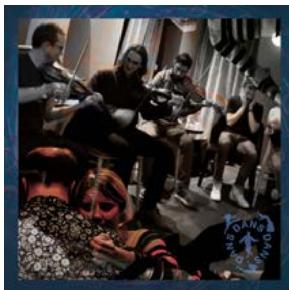
Grafikk: Torbjørn B. Lauen